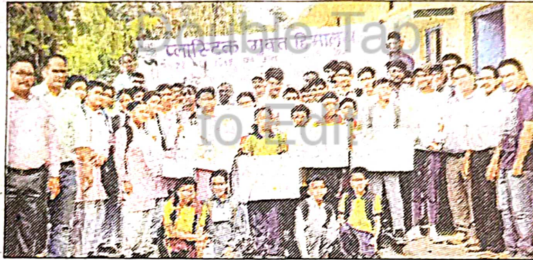
श्रीनगर में जीबी पंत राष्ट्रीय पर्यावरण संस्थान में जैव विविधता दिवस पर पेंटिंग दिखाते स्कूली छात्र।